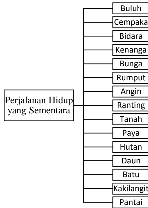
Rajah 2: Kata kunci unsur kosmos berdasarkan konsep perjalanan hidup yang sementara

Kata kunci “buluh”, “cempaka”, “bidara”, “kenanga”, “bunga”, “hutan”, “batu”, “bukit”, “daun”, “ranting”, “tanah”, “rumput”, “paya”, “pantai” dan simbol “angin” ialah simbolik unsur kosmos kepada konsep perjalanan hidup yang sementara dalam puisi Tiada Lagi Dunia, Sementara dan Alun Dalam . Melalui petikan puisi Tiada Lagi Dunia dapat diketahui penggunaan kata kunci “buluh”, “cempaka”, “bidara”, “kenanga”, dan simbol “bunga” berkaitan wanita, iaitu watak nenek. Bunga-bunga juga sering dikaitkan dengan bau wangi yang lembut. Hal ini telah diungkapkan secara simbolik oleh penyair untuk sifat nenek yang begitu lembut dan akan kekal diingati oleh anak cucunya. Sesuai dengan tajuk Tiada Lagi Dunia , idea penyair ialah berteraskan kehidupan di dunia hanya sementara begitu juga alam semesta ini.