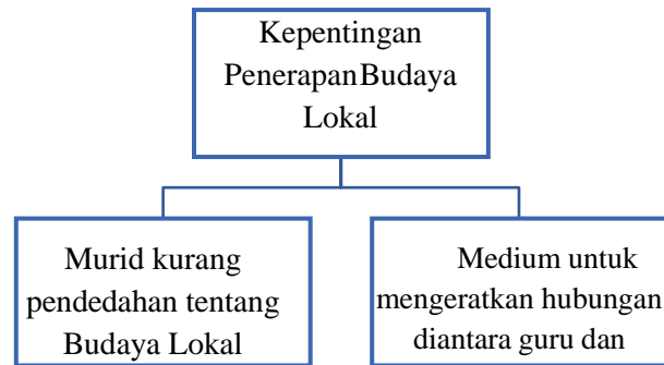
Gambarajah 2 Kepentingan Penerapan Budaya Lokal