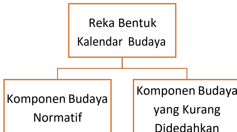
Gambarajah 3 Reka Bentuk Kalendar Budaya